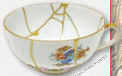
Utensilios de porcelana reconstituidos usando «kintsugi». Al fondo, dibujos en un jarrón japonés de la era Meiji