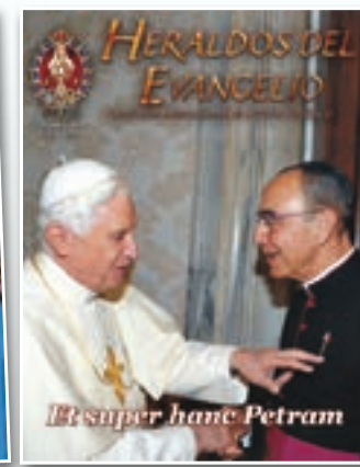
Enero de 2010 - En audiencia con el fundador, Benedicto XVI bendice la obra de los Heraldos del Evangelio