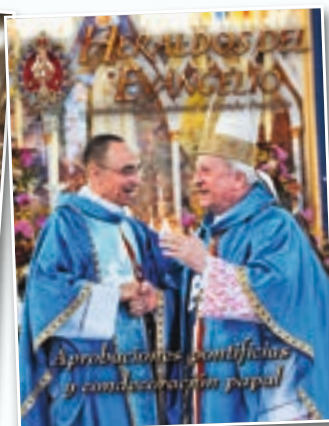
Septiembre de 2009 - El Papa Benedicto XVI concede a Mons. João la medalla «Pro Ecclesia et Pontifice»