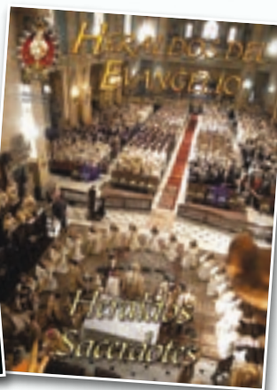
Julio de 2005 - Un paso histórico para la obra: nace la rama sacerdotal de los Heraldos